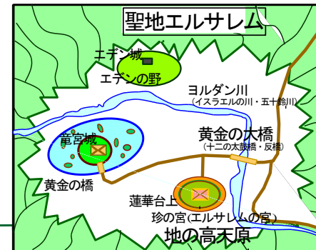
周囲は屏風を立てたような青山で囲まれている

太古の地理と現在の地理は若干異なっているそうです。 霊界物語の世界を理解するための地図です。